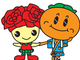
ローズちゃん パーシーちゃん